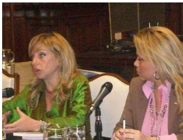
La titular del INADI, Dra María José Lubertino, expone ante la Comisión de Ciudadanía del PM

La presidenta del Instituto Nacional contra la Discriminación, la Xenofobia y el Racismo (INADI), María José Lubertino, centró su informe en la situación de discriminación que sufren las comunidades boliviana, paraguaya y peruana, así como también los avances en la lucha contra tales prácticas. En ese sentido, resaltó la importancia que el Gobierno Nacional otorga a la política antidiscriminatoria al aumentar considerablemente el presupuesto dispuesto para el área.