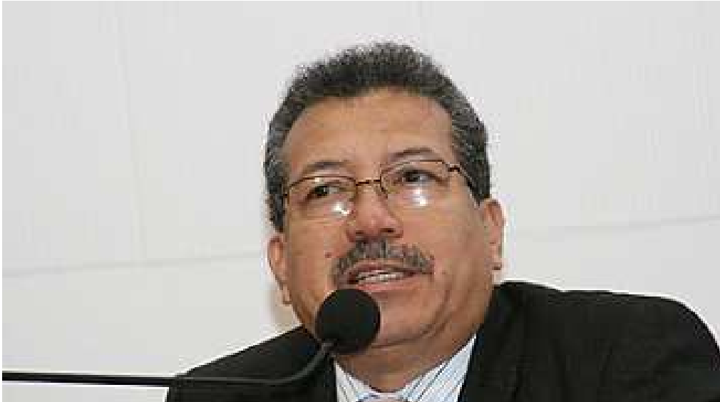
El parlamentario por Carabobo, Venezuela, ha sido designado presidente del Parlamento del Mercosur