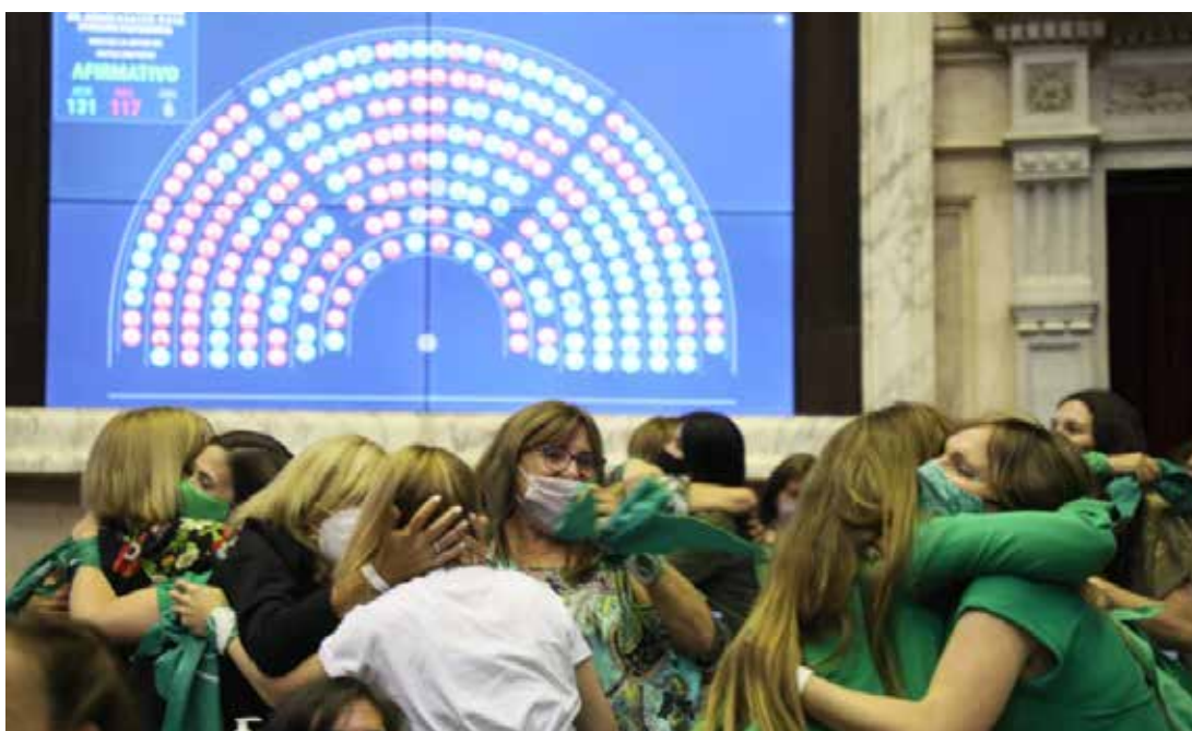
Abrazo de Sanción.

Se procura el uso de lenguaje inclusivo, no sexista. A fin de facilitar la lectura, no se incluyen recursos como la @, la X o las barras “os/as”. En aquellos casos en que no se ha podido evitar el uso del masculino, solicitamos que se tenga en cuenta la intención no sexista en la redacción.