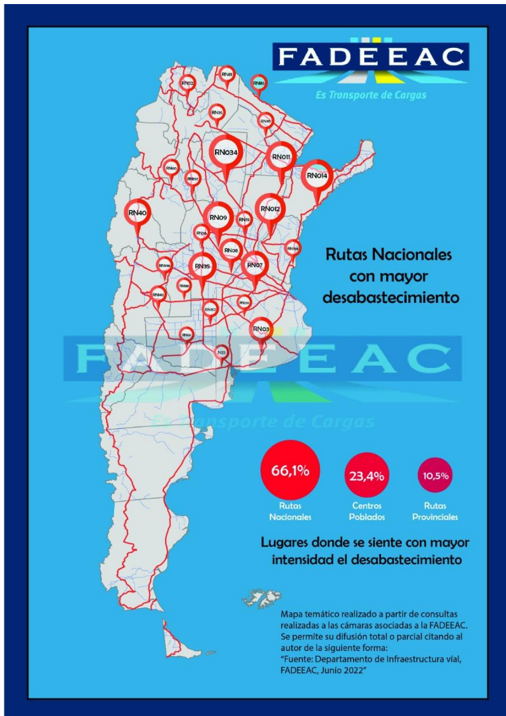
Imagen1. Rutas con mayor nivel de desabastecimiento. El 66,1% corresponde a Rutas Nacionales; el 23,4% corresponde a Centros Poblados y el 10,5% corresponde a Rutas Provinciales.