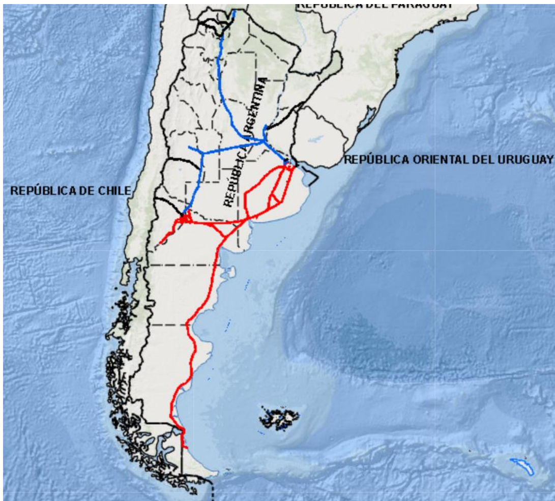
Grafico n. 2: Mapa de redes de gasoductos en el territorio argentino.