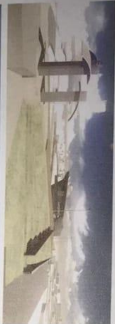
VISTA EXTERIOR 1

Perspectivas y vistas exteriores del complejo habitacional en relación al entorno y vecindario