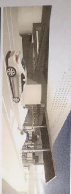
VISTA EXTERIOR 3

Integrado con el contexto, el nuevo edificio (edificio tipo) – muestra el edificio