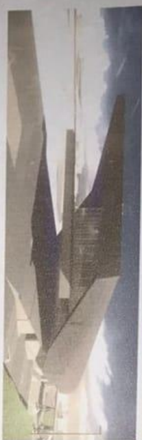
VISTA EXTERIOR 2

Se observa desde este punto de vista las estructuras sustanciales y de mayor escala y altura, así como el acceso vehicular (edificio tipo – parte visible del edificio)