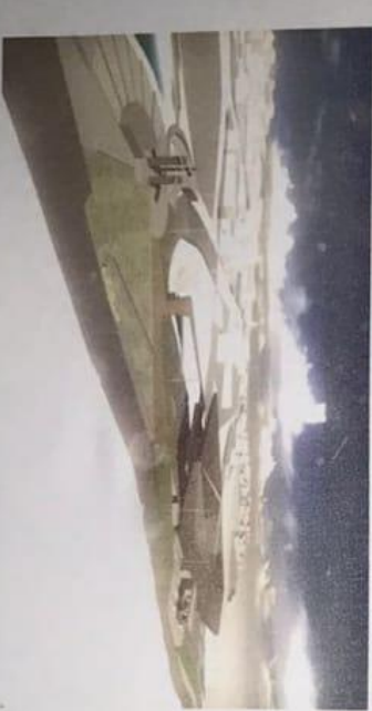
VISTA EXTERIOR 4

Para vehicular adelante, queda de consagrarse y visualización adelante desde el vehículo, se puede observar el edificio nuevo y el edificio existente, así como el acceso vehicular y parte parte de la estructura del edificio.