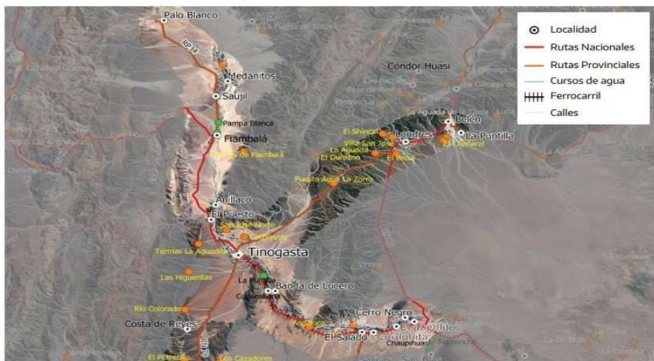
CORREDOR DE INFLUENCIA TINOGASTA