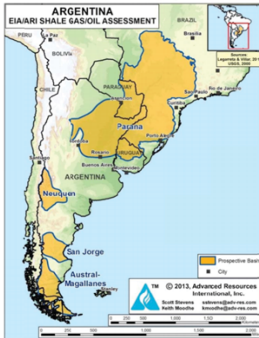
Figure V-1. Prospective Shale Basins of Argentina

una reserva calculada de 37.000 km 3 . Como puede observarse, en los mapas presentados a continuación,