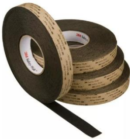
IMAGEN A MODO ILUSTRATIVO:

Todos los productos solicitados deberán contar con una garantía escrita por un mínimo de SEIS (6) meses.